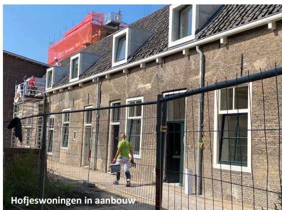
Hofjeswoningen in aanbouw

■ Hofjeswoningen links ■ Het Blauwhuis midden ■ Schoolhouses rechts